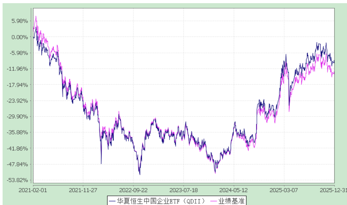
华夏恒生中国企业交易型开放式指数证券投资基金（QDII） 基金份额累计净值增长率与业绩比较基准收益率的历史走势对比图 (2021年2月1日至2025年12月31日)