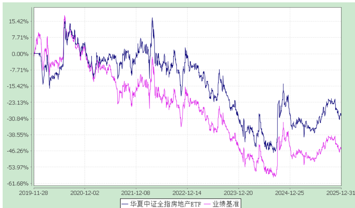
华夏中证全指房地产交易型开放式指数证券投资基金 份额累计净值增长率与业绩比较基准收益率历史走势对比图 (2019年11月28日至2025年12月31日)