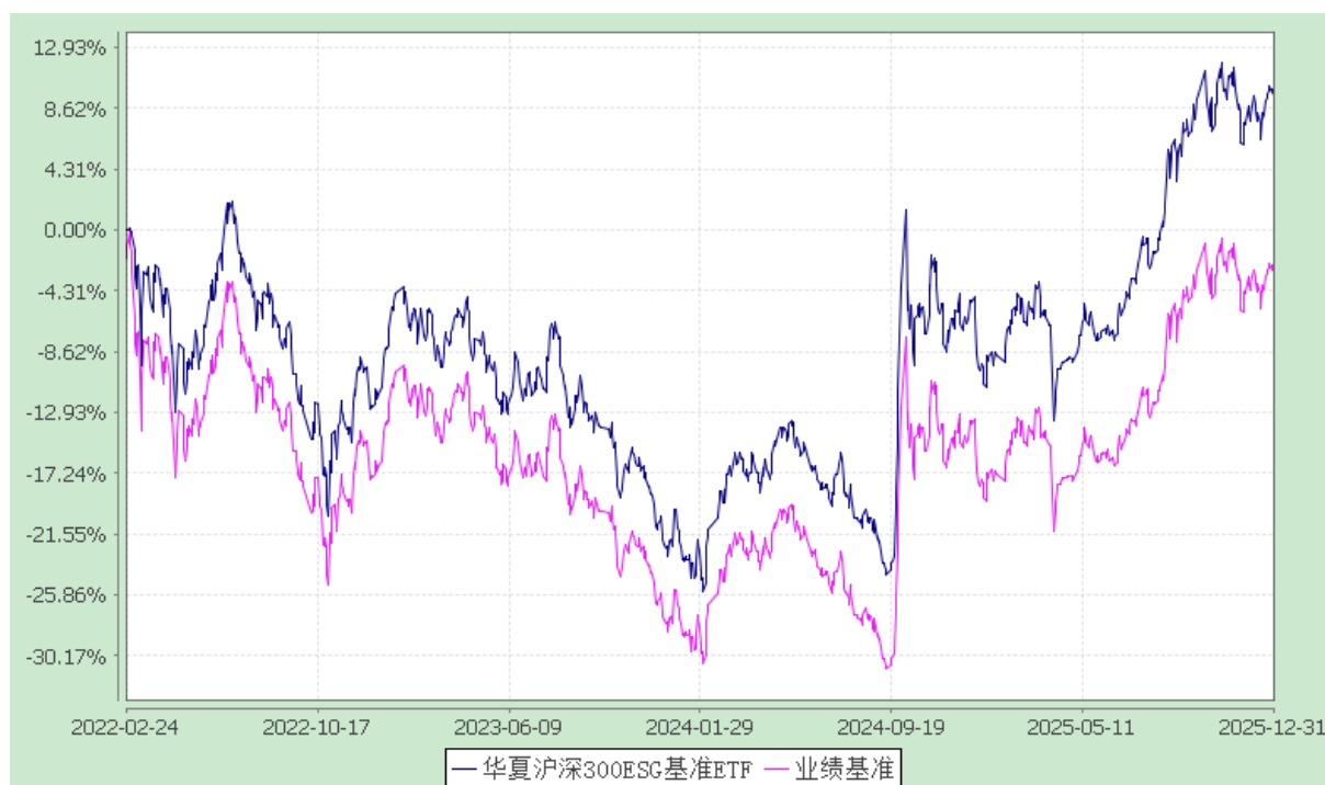
华夏沪深 300ESG 基准交易型开放式指数证券投资基金 份额累计净值增长率与业绩比较基准收益率历史走势对比图 (2022 年 2 月 24 日至 2025 年 12 月 31 日)