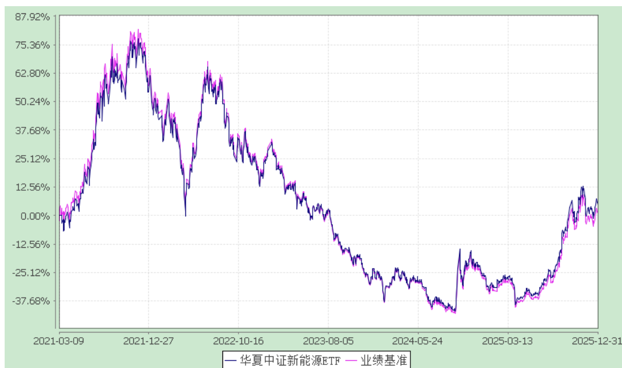
华夏中证新能源交易型开放式指数证券投资基金 份额累计净值增长率与业绩比较基准收益率历史走势对比图 (2021年3月9日至2025年12月31日)