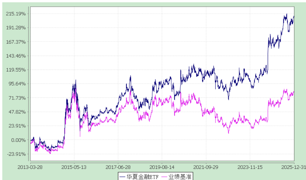
上证金融地产交易型开放式指数发起式证券投资基金 份额累计净值增长率与业绩比较基准收益率历史走势对比图 (2013年3月28日至2025年12月31日)