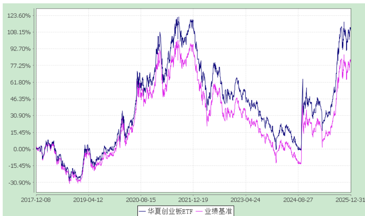
华夏创业板交易型开放式指数证券投资基金 份额累计净值增长率与业绩比较基准收益率历史走势对比图 (2017年12月8日至2025年12月31日)