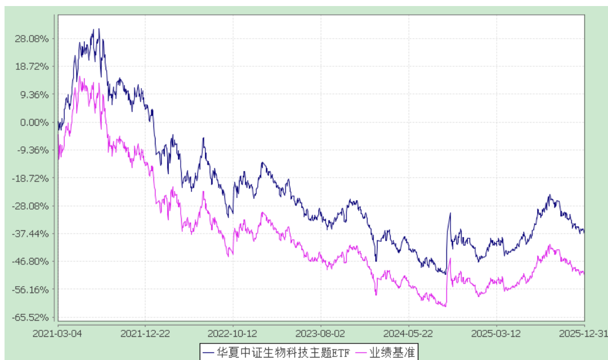
华夏中证生物科技主题交易型开放式指数证券投资基金 份额累计净值增长率与业绩比较基准收益率历史走势对比图 (2021年3月4日至2025年12月31日)