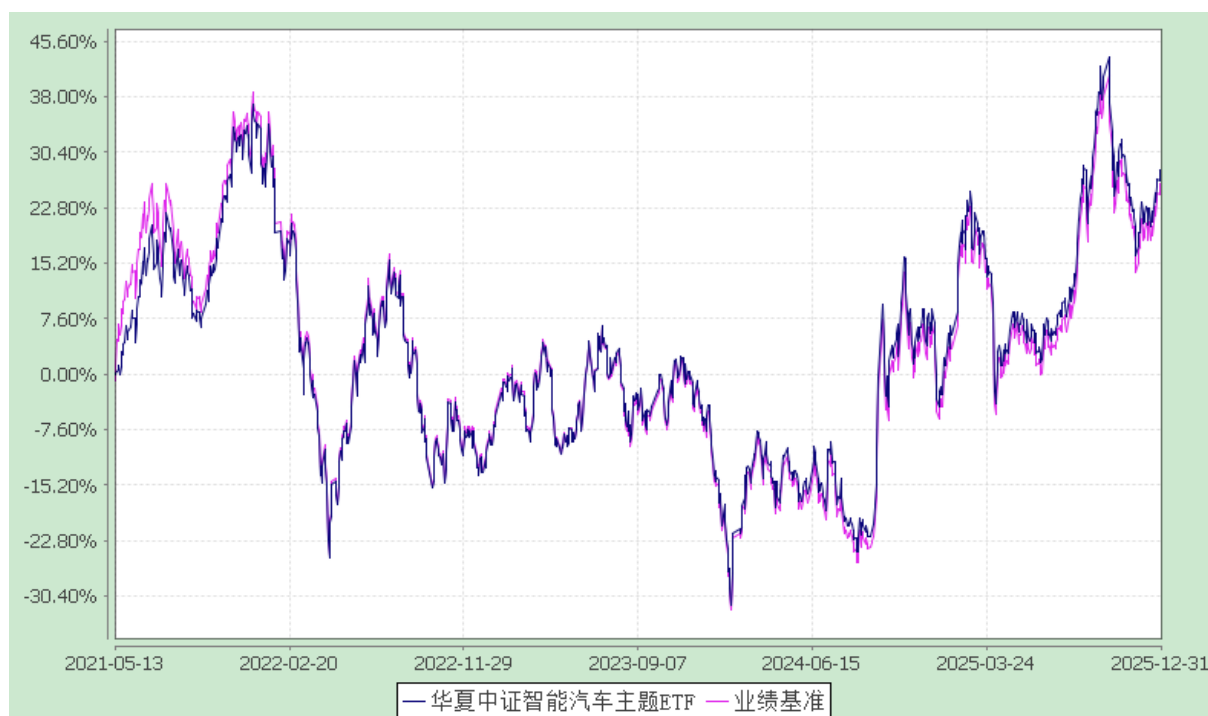
华夏中证智能汽车主题交易型开放式指数证券投资基金 份额累计净值增长率与业绩比较基准收益率历史走势对比图 (2021年5月13日至2025年12月31日)