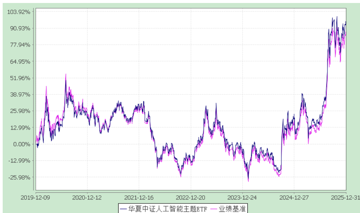
华夏中证人工智能主题交易型开放式指数证券投资基金 份额累计净值增长率与业绩比较基准收益率历史走势对比图 (2019年12月9日至2025年12月31日)