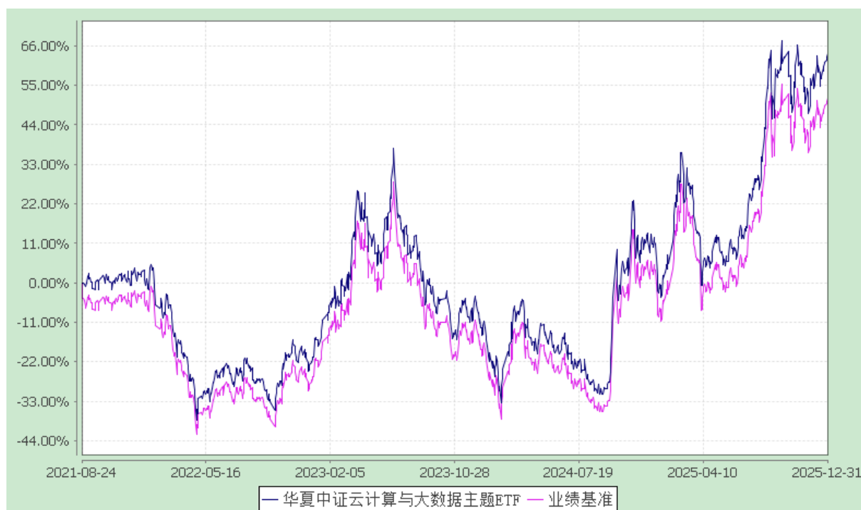
华夏中证云计算与大数据主题交易型开放式指数证券投资基金 份额累计净值增长率与业绩比较基准收益率历史走势对比图 (2021年8月24日至2025年12月31日)