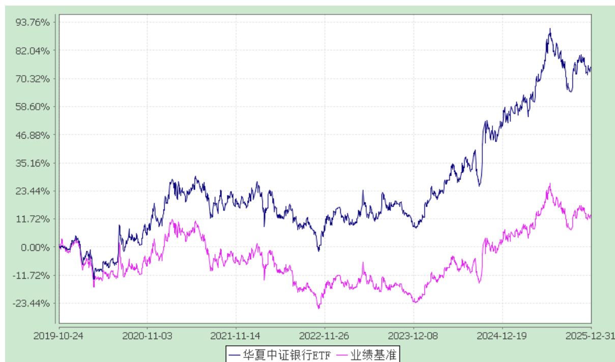
华夏中证银行交易型开放式指数证券投资基金 份额累计净值增长率与业绩比较基准收益率历史走势对比图 (2019年10月24日至2025年12月31日)