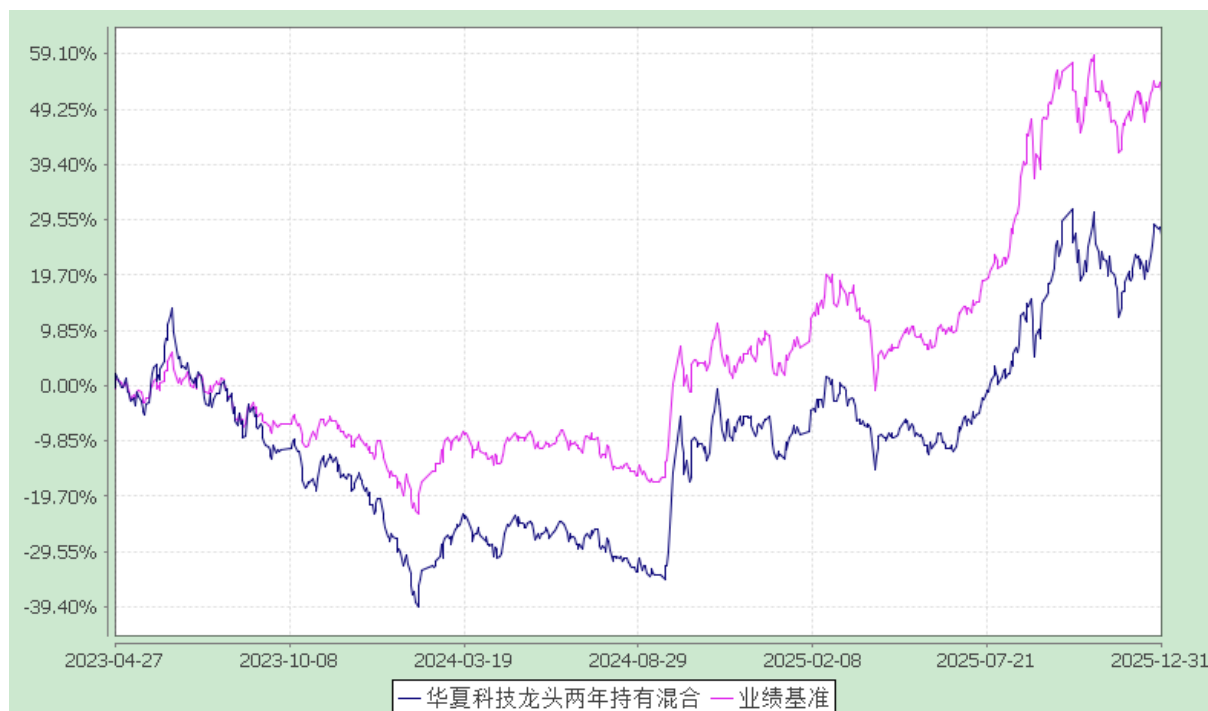
华夏科技龙头两年持有期混合型证券投资基金 份额累计净值增长率与业绩比较基准收益率历史走势对比图 (2023年4月27日至2025年12月31日)

注：本基金自 2023 年 4 月 27 日起由“华夏科技龙头两年定期开放混合型证券投资基金”转型而来。