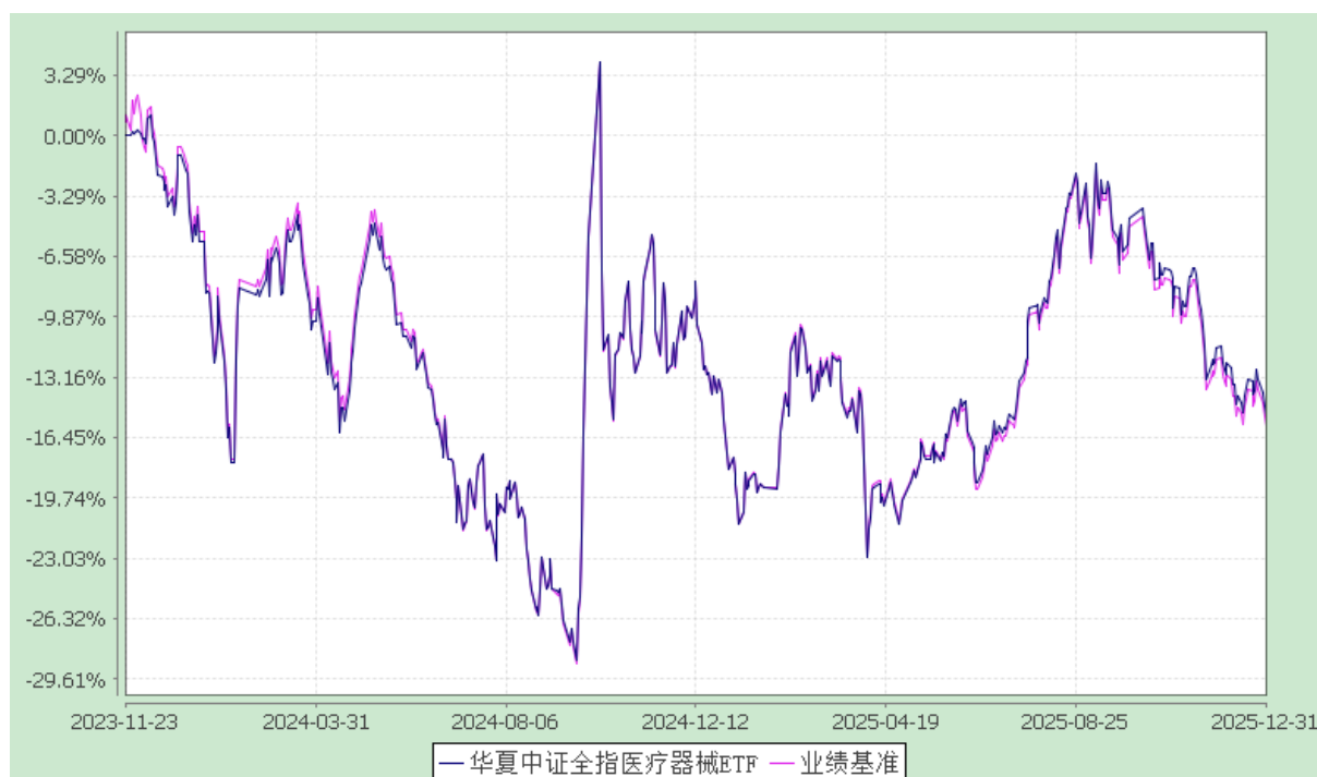
华夏中证全指医疗器械交易型开放式指数证券投资基金 份额累计净值增长率与业绩比较基准收益率历史走势对比图 (2023 年 11 月 23 日至 2025 年 12 月 31 日)