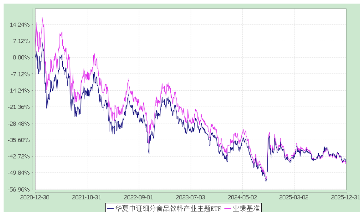
华夏中证细分食品饮料产业主题交易型开放式指数证券投资基金 份额累计净值增长率与业绩比较基准收益率历史走势对比图 (2020年12月30日至2025年12月31日)