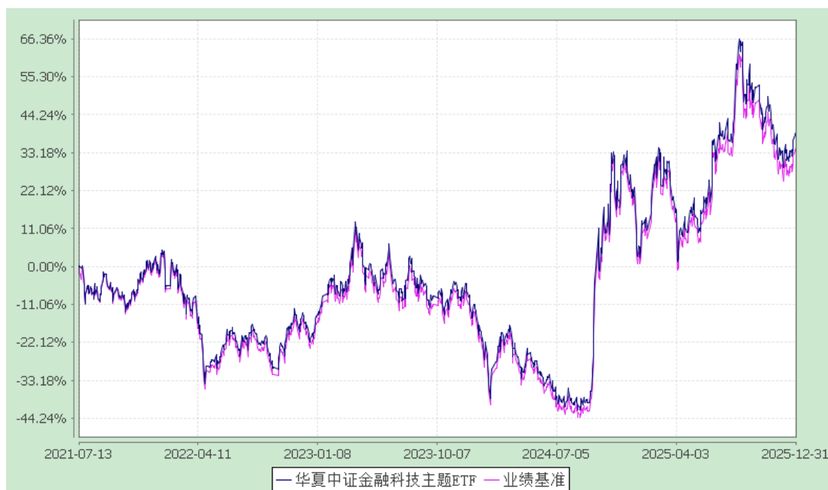
华夏中证金融科技主题交易型开放式指数证券投资基金 份额累计净值增长率与业绩比较基准收益率历史走势对比图 (2021年7月13日至2025年12月31日)