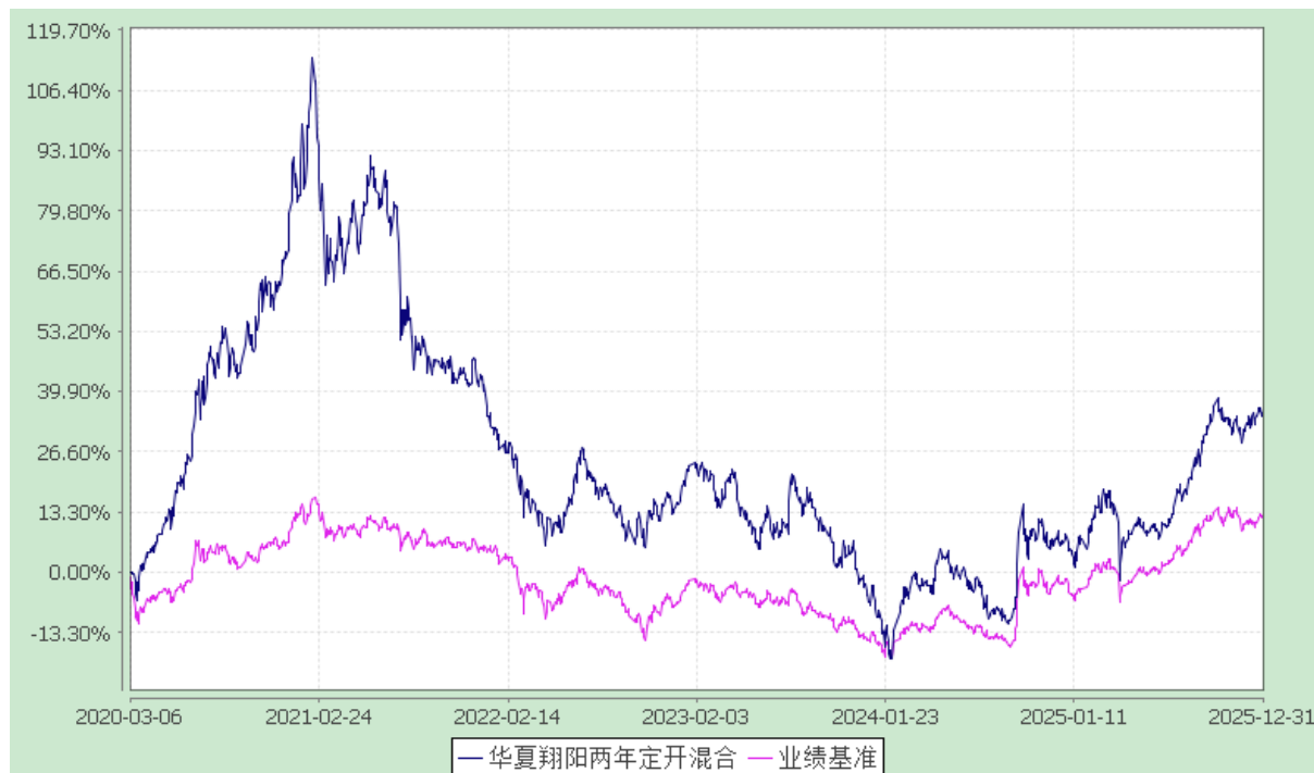
华夏翔阳两年定期开放混合型证券投资基金 份额累计净值增长率与业绩比较基准收益率历史走势对比图 (2020年3月6日至2025年12月31日)