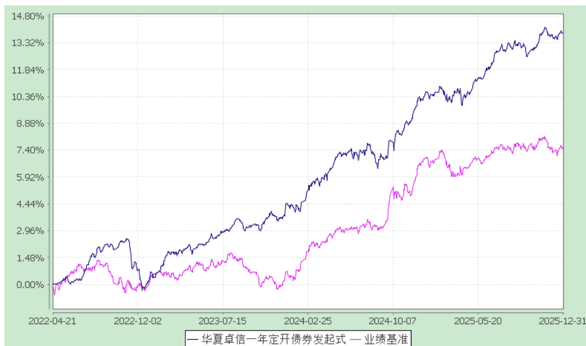
华夏卓信一年定期开放债券型发起式证券投资基金 份额累计净值增长率与业绩比较基准收益率历史走势对比图 (2022 年 4 月 21 日至 2025 年 12 月 31 日)