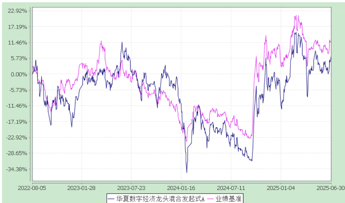
华夏数字经济龙头混合发起式 C