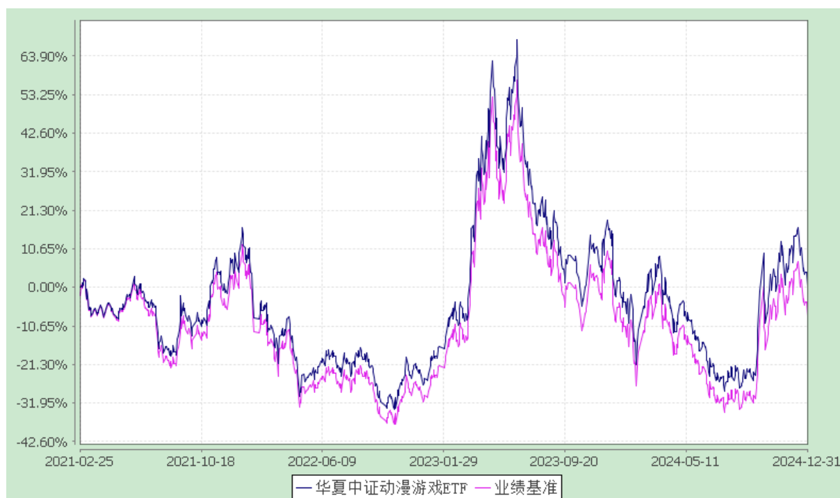
华夏中证动漫游戏交易型开放式指数证券投资基金 份额累计净值增长率与业绩比较基准收益率历史走势对比图 (2021年2月25日至2024年12月31日)